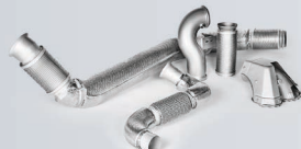
管件，零泄漏，热管理