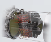
具有最佳流动和混合性能 的封装及系统集成